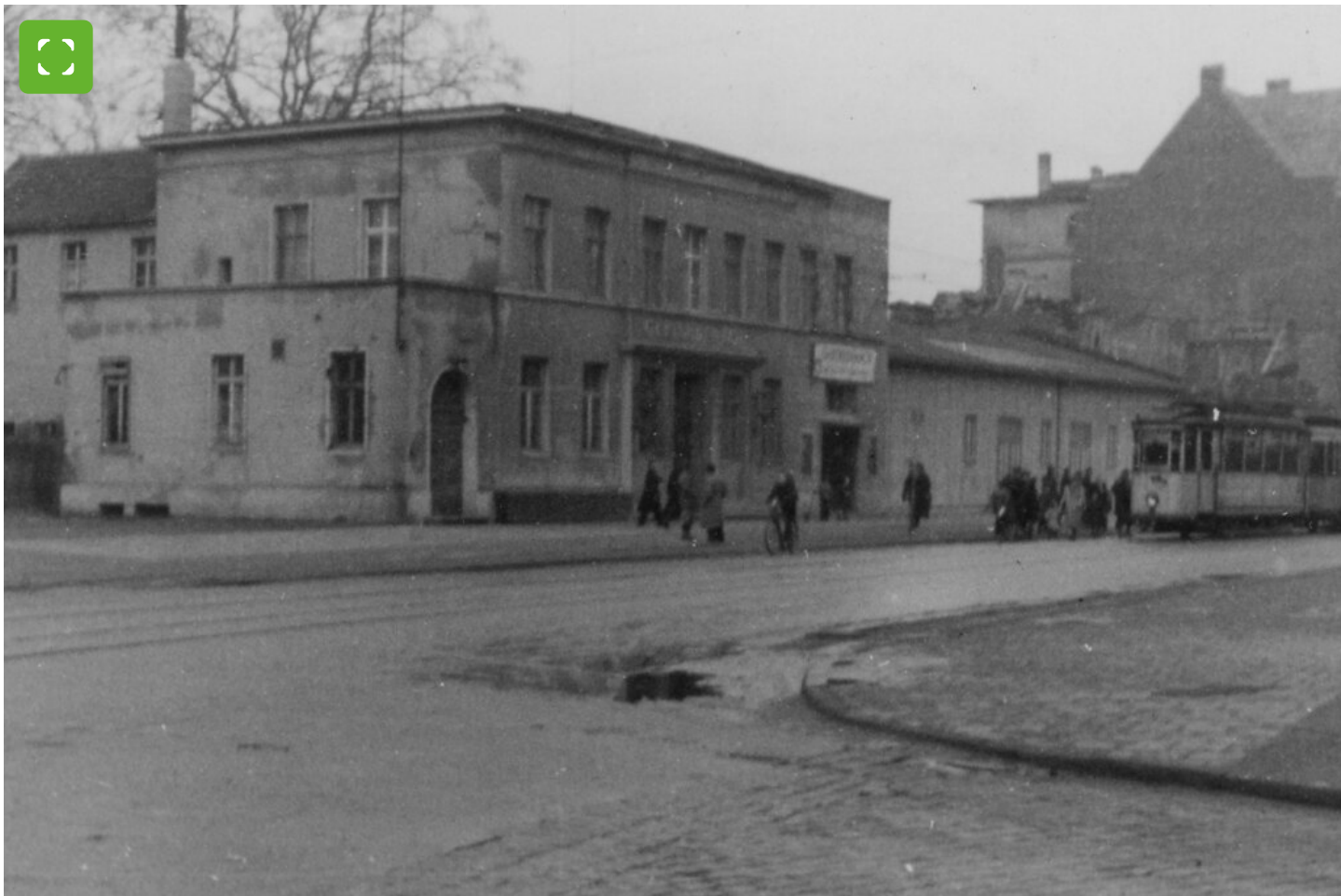
© Stadtarchiv Münster, Fotosammlung Slg-FS-47, Nr. 26402

" Op bevel van de Geheime Staatspolitie werden 26 Joden* gedeporteerd van Bocholt naar Riga.