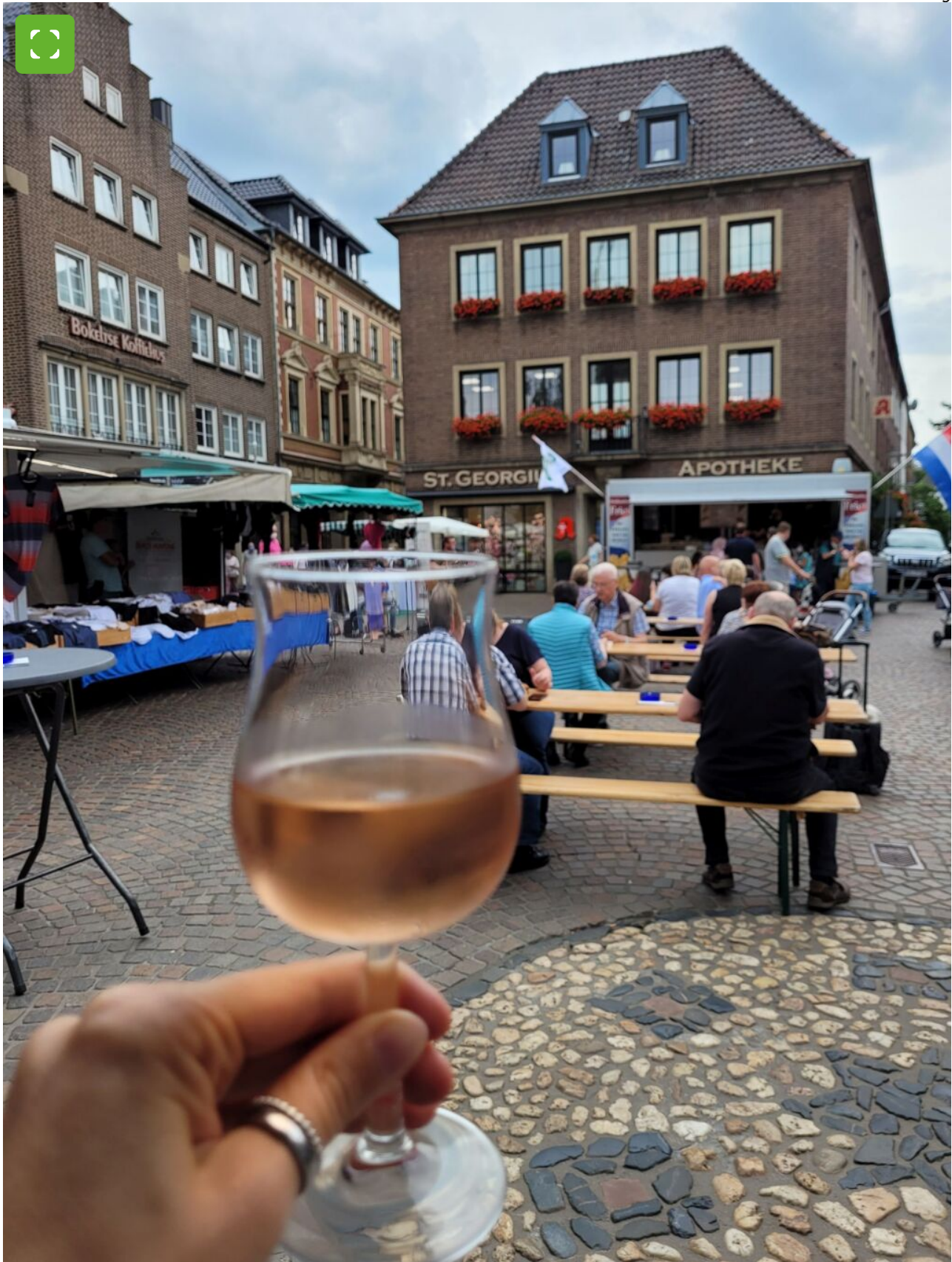
Genießer-Pause auf dem Abendmarkt in Bocholt.