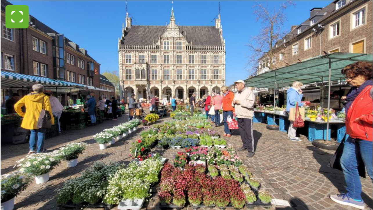
Wochenmarkt vor dem historischen Rathaus von Bocholt.

Die Stadt Bocholt liegt im westlichen Münsterland im Nordwesten von Nordrhein-Westfalen und ist mit 71.000 Einwohnerinnen und Einwohnern die größte kreisangehörige Stadt des Kreises Borken.