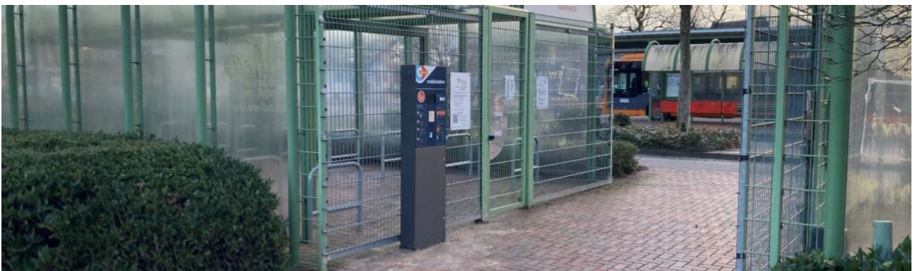
Radbox am Bahnhof ►