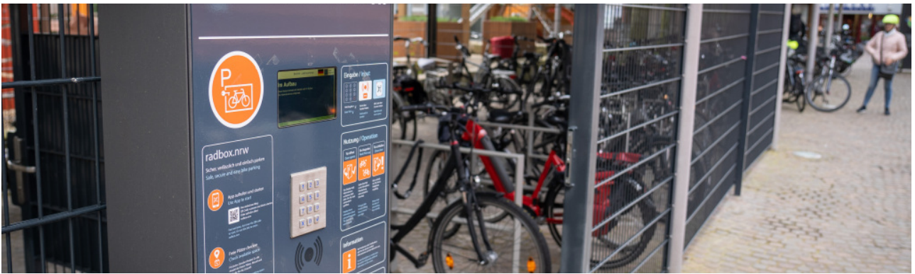
Radbox am Liebfrauenplatz ►