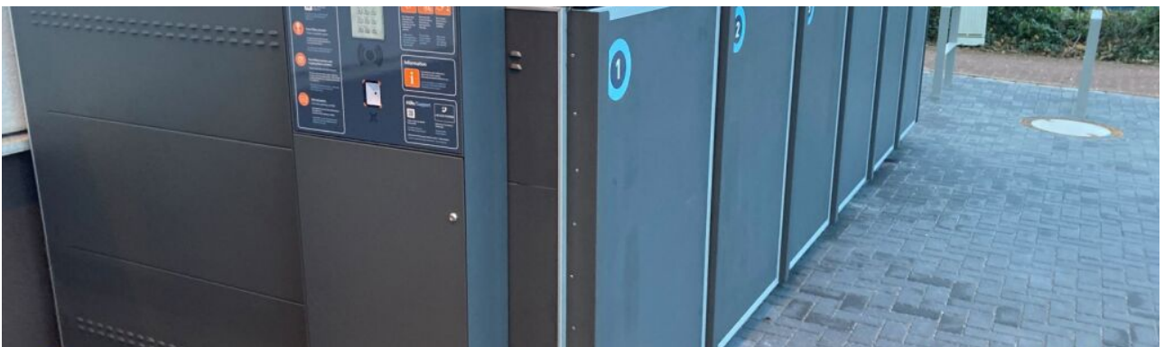
Radbox an den Arkaden ►