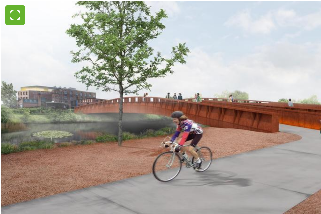
© Bureau B+B stedenbouw / SeARCH architecture and urbanism