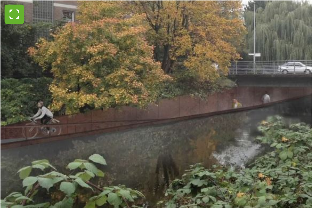
© Bureau B+B stedenbouw / SeARCH architecture and urbanism