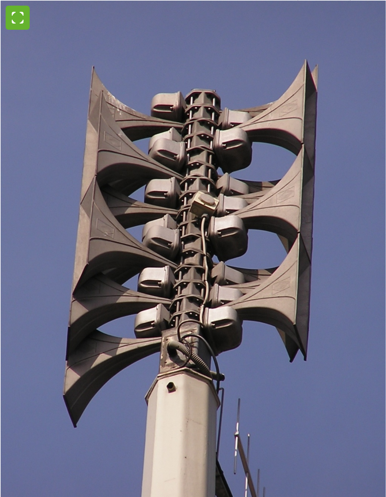
Voorbeeld van een elektronische sirene