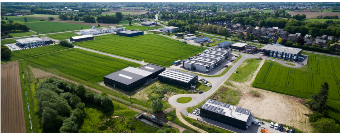
Holtwick Industrial Park ▶