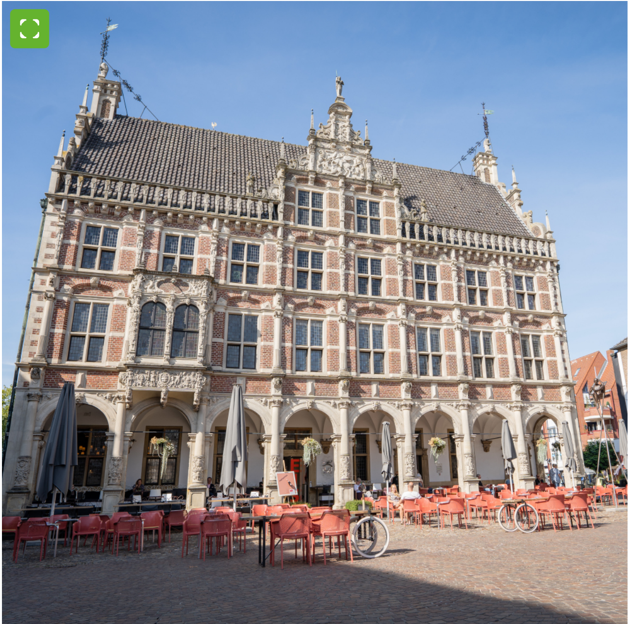
Historisches Rathaus in Bocholt

Das Wahrzeichen der Stadt, erbaut 1618-1624 in niederländischer Renaissance. Zerstört und wiederaufgebaut nach Ende des zweiten Weltkriegs. Zusammen mit der St. Georg Kirche, dem ältesten Bauwerk Bocholts, bildet das Historische Rathaus am Marktplatz den Mittelpunkt der Stadt. Das Trauzimmer ist ein beliebter Ort zum Heiraten.