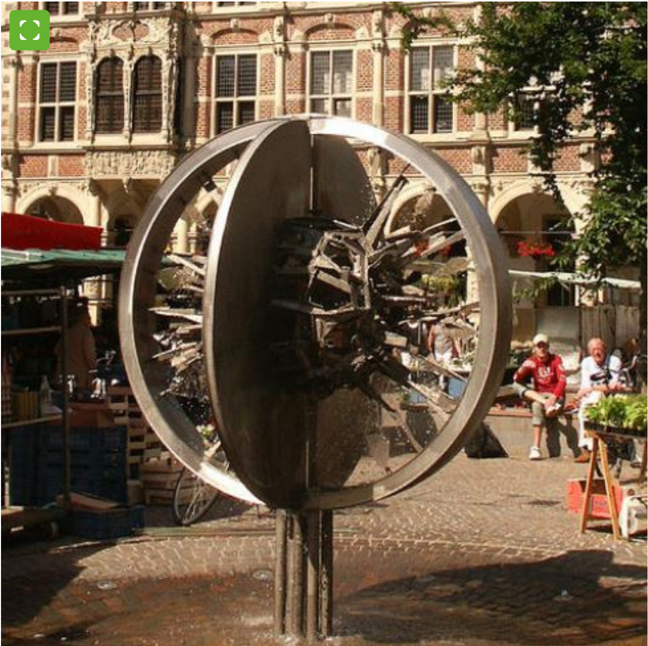
Europa-Brunnen in Bocholt

Bocholt wurde 1972 die Ehrenbezeichnung "Gemeinde Europas" verliehen, es folgten die Europafahnen und die Bezeichnung "Europastadt". Die Verleihung des Titels war Anlass für die Erstellung des Europa-Brunnens vor dem Historischen Rathaus. Künstler Friederich Werthmann entwarf die Stahlplastik zur 750-Jahrfeier. Zur Darstellung benutzt er eine Kugel in durchbrochener Form. Symbolisiert werden die Weltkugel, die Erdscheibe und der Sonnenring.